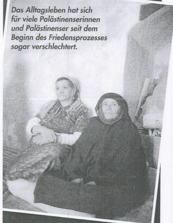
Das Alltagsleben hat sich für viele Palästinenserinnen und Palästinenser seit dem Beginn des Friedensprozesses sogar verschlechtert.

Israel wurde einen Teil des unregierbaren Gaza-Streifens los, ohne eine substantielle Konzession zu machen. Israel ist es gelungen, international den Eindruck zu erwecken, als handele es sich bei Gaza, Jericho und die anderen Städte in der Westbank um selbständige Gebilde. Dagegen sind ca. 40 Prozent des Gaza-Streifens und 70 Prozent der Westbank weiter unter israelischer Oberhoheit; keine Siedlung wurde aufgelöst, sie sind exterritorial. Sie unterliegen ausschließlich israelischer Jurisdiktion, auf dem Rest des Gaza-Streifens tummeln sich über 934.000 Palästinenser. Alle Militärverordnungen bestehen weiter, neue sind hinzugekommen, und die PLO muß sie umsetzen und darf ohne die Zustimmung Israels keine Verordnungen erlassen, die den Militärverordnungen widersprechen. Israel hat das alleinige Sagen, was die Außenpolitik, die Großprojekte der Wirtschaft und die Belange der Sicherheit angeht. Selbst im wirtschaftlichen Bereich kann die palästinensische Autorität keine Gesetzesänderungen eigenständig durchführen, weil diese vom gemeinsamen israelisch-palästinensischen Ausschuß für wirtschaftliche Zusammenarbeit verabschiedet werden müssen. Das Land kann jederzeit die Gebiete insgesamt – oder jede Autonomieinsel für sich – abriegeln, was seit den Terroranschlägen vom Februar und März auch mehrfach geschehen ist. Dadurch sitzen die Palästinenser wie die Maus in der Falle. Was ist eine Autorität wert, die noch nicht einmal über die Ein- und Ausreise seiner